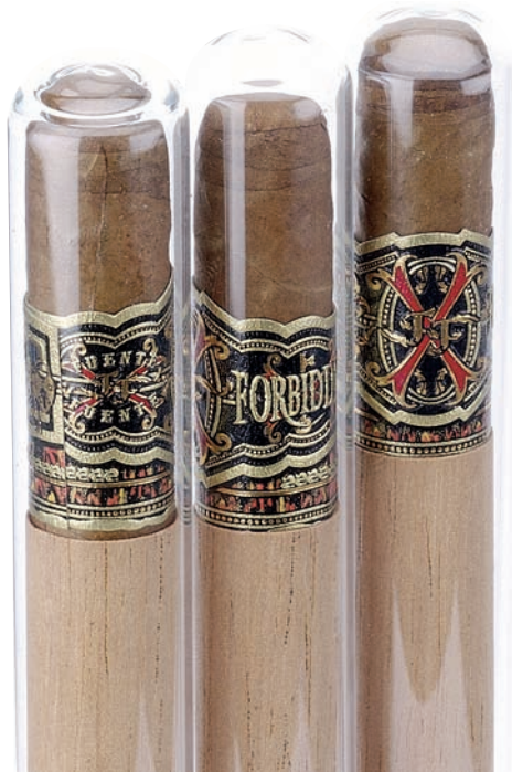
Zigarren in Glastuben eignen sich besonders gut für die Reise Cigars in glass tubes are well suited to be taken on trips

Since this column first appeared readers have sent in many questions. In this and the following issue we intend to publish the most serious issues and thus make them accessible to all.